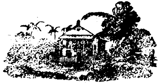
Sitio á venda

De 1º e 2º qualidade, americano e marca azul, vende-se na saboaria à vapor de 500 reis à 560 reis o kilo, com tara de 2 1/2 kilos em cada caixa.